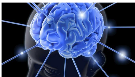
Obrázok 1 Závislosť